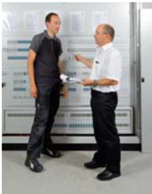
Règle 1 Exiger des mandats précis