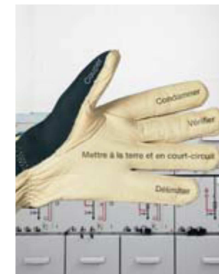
+ 5 règles de sécurité Pour les travaux hors tension.