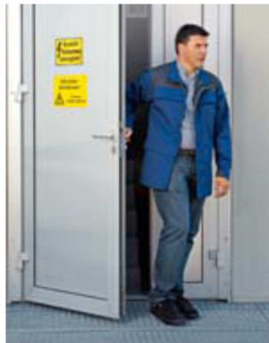
Règle 2 Employer du personnel qualifié.